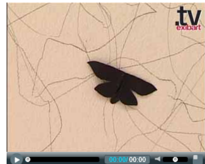
report / CARLOS AMORALES, REMIX - Palazzo delle Esposizioni, Roma