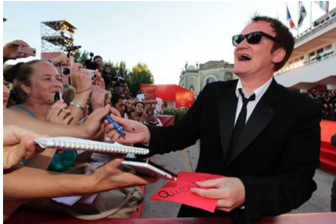
Il presidente della giuria Quentin Tarantino

Tra le opere migliori in concorso si contano invece Meek's Cutoff dell'americana Kelly Reichardt, scarna quanto evocativa messa in scena della lotta tra uomo e paesaggio nell'Oregon del 1845 - si potrebbe definirlo un anti-western - e Ovsyanki di Aleksi Fedorchenko, opera dal ritmo dilatato, ricca di riferimenti all'antropologia e alla ritualità.